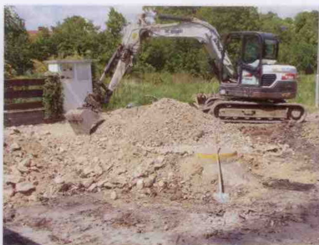
Obnova povrchu místních komunikací v části „Poříčiny“.