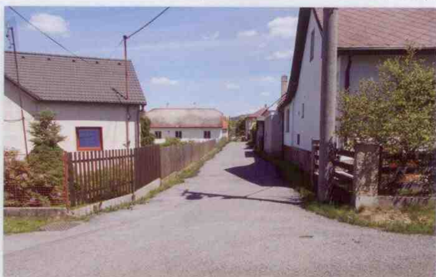
Spojovací ulička na „Kudibalce“ před opravou a po opravě.