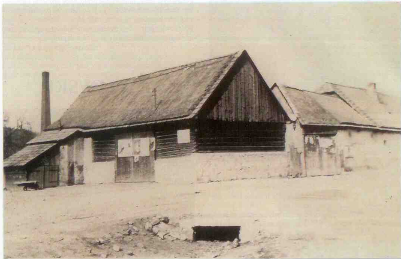
Obr. 1: Roubená stodola a čp. 1 v roce 1925.

Součástí dobřívské návsi je také čp. 1 takzvaný statek „U Schořů“, na kterém hospodařil před rokem 1717 Petr Dezort,