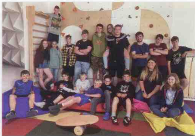
Dobřiváci v oblíbené herně naší školy.