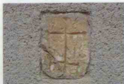
Obr. 3: Záhadný kámen ve zdi čp. 1.

na něm zřejmě pravoslavný kříž a letopočet 1813 nebo 1817. Jeho interpretace je velmi sporná, údajně má jít o původní