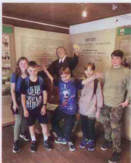
V rámci oslav Dne dětí vyrazili žáci 7. B do Dobřiva, zúčastnili se prohlídky vodního hamru a Mošnovy jizby. Na fotografii jsou Dobřiváci ze 7. B.

Na začátku dubna proběhla tradiční akce jarní zpívání, které je přístupné i veřejnosti a každá třída si pod vedením pana učitele