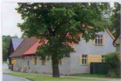
Obr. 2: Čp. 1 v současnosti.

Součástí dobřívské návsi je také čp. 1 takzvaný statek „U Schořů“, na kterém hospodařil před rokem 1717 Petr Dezort,